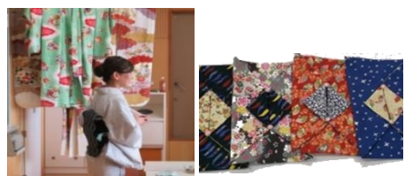
布製ティッシュペーパーケースづくり体験