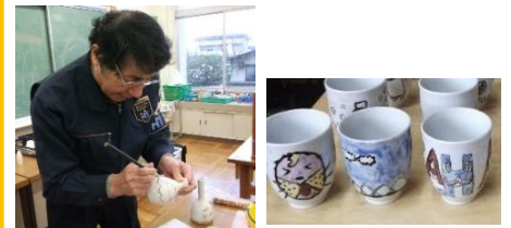
九谷焼絵付け体験