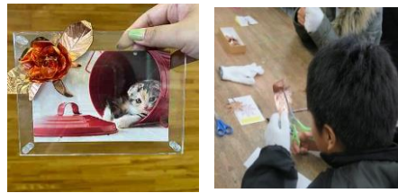
銅板バラの花づくり体験