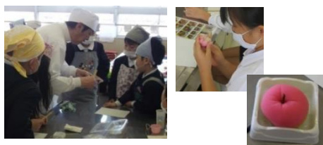
和菓子づくり体験