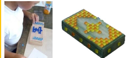
タイル張り小物入れづくり体験

お申し込み先：石川県技能振興コーナー（石川県職業能力開発協会） 〒920-0862 石川県金沢市芳斉1丁目15番15号 TEL 076-254-6487 FAX 076-262-3913