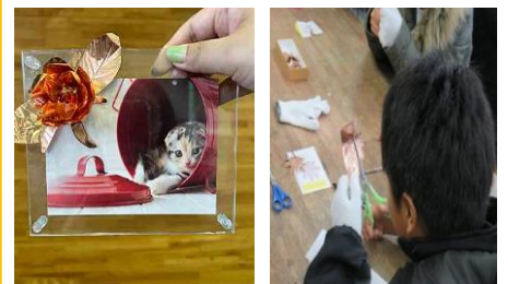
銅板バラの花づくり体験