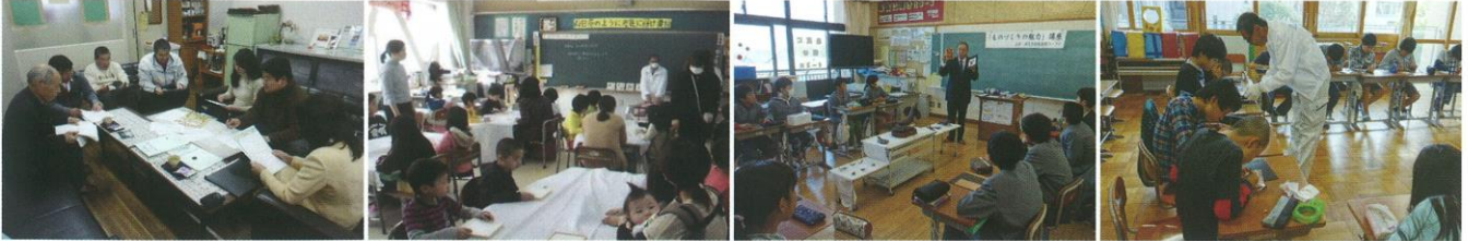
ものづくりマイスターの講義(教師) ものづくりマイスターの講義(児童・保護者) ものづくりマイスターの講義(児童) ものづくり体験(児童)