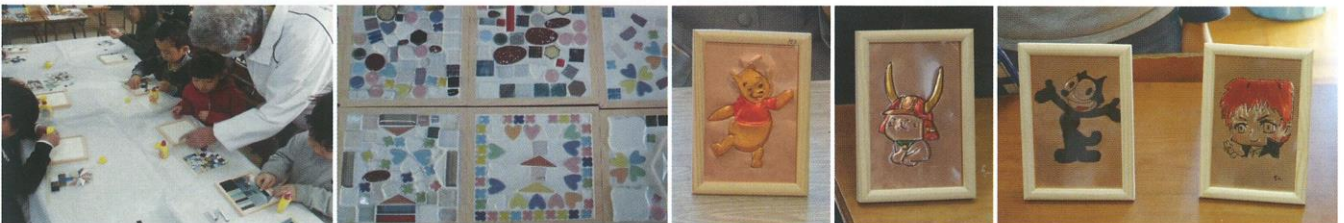
ものづくり体験(児童)